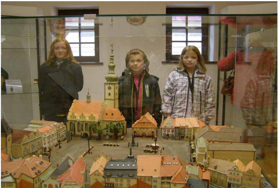
Za družinu Berušky Bobík

Ač ráno bylo mlhavé počasí, náladu nám to nezkazilo. V ZOO i v muzeu se nám velice líbilo. Už se těšíme na další výpravu.