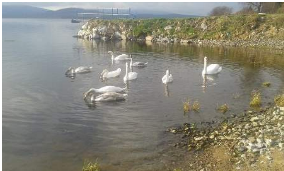
Ema Kondysková, pension Calla, Dolní Vltavice

Když se Honzík stal králem, dal na místě, kde ho málem chytili biřicové, a kde mu pomohla kouzelná labuť, postavit své letní sídlo, které z vděčnosti pojmenoval po květině, která mu zachránila život, CALLA. Dlouho, velmi dlouho po té tu vyrostl pension CALLA, kam potomci kouzelné labutě připlouvají každé letní ráno. Pokud si tiše přisednete k vodě a budete bedlivě naslouchat jejich tichému štěbetání, možná vám poví i Pašeráckou pohádku.