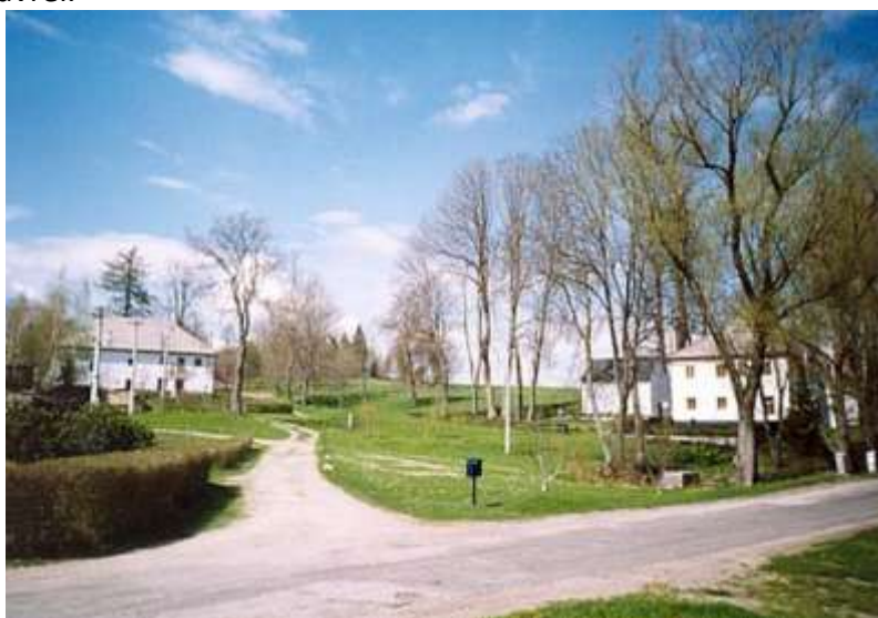
Náves na Pláničky v současnosti – čistě rekreační osada

Nastal konec roku, školu opustily čtyři děti, na prázdniny odešli všichni zdraví a šťastni. Škola tiše vyhlíží osamělá, je konec práce nad knihou a sešity. V srpnu se škola vybilila a uklidila, kruh roku se uzavřel.