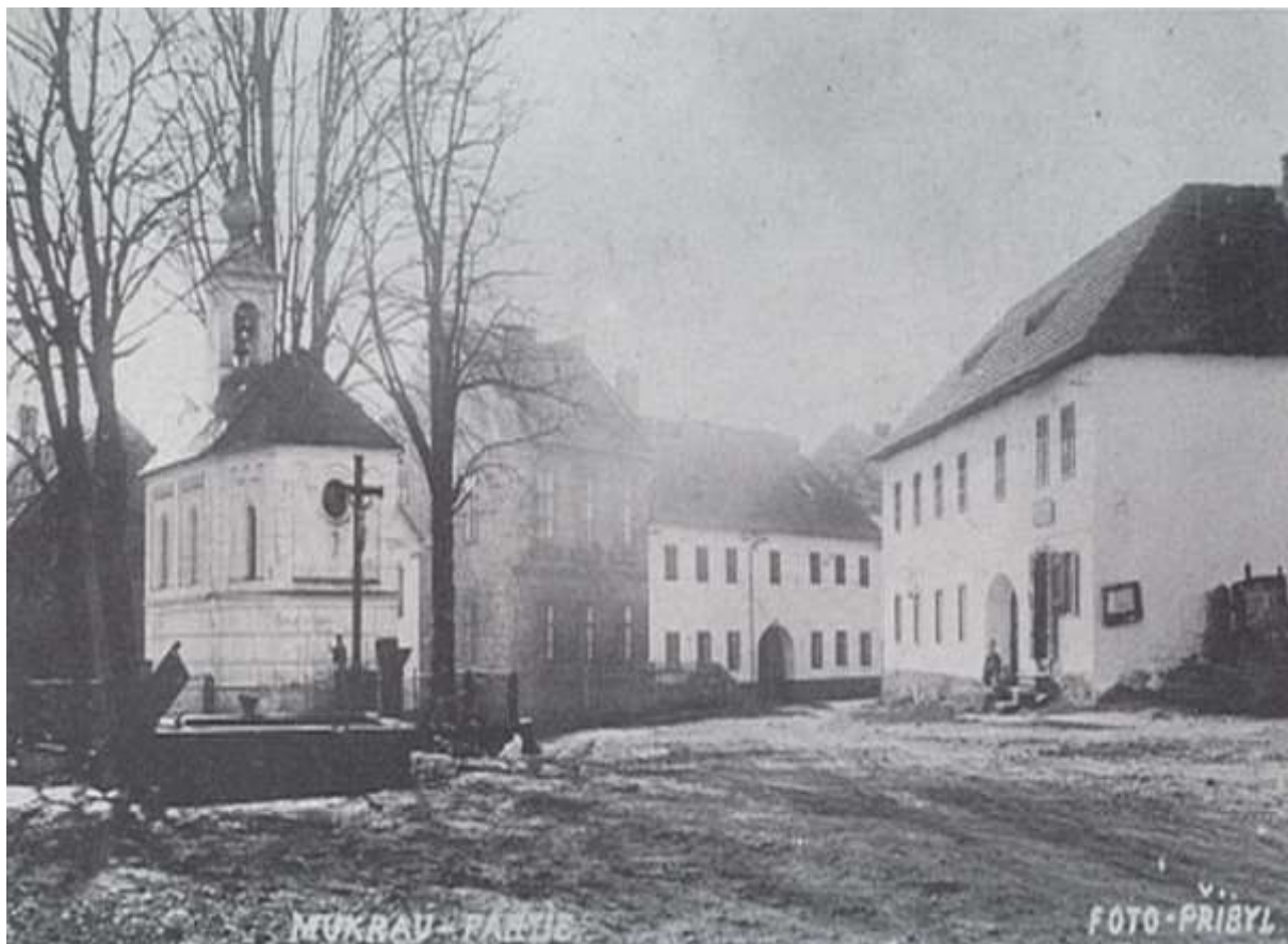
Pohled na náves v Mokré – historické foto

Toto je vše, co je kolem školy v Mokré zatím známo .