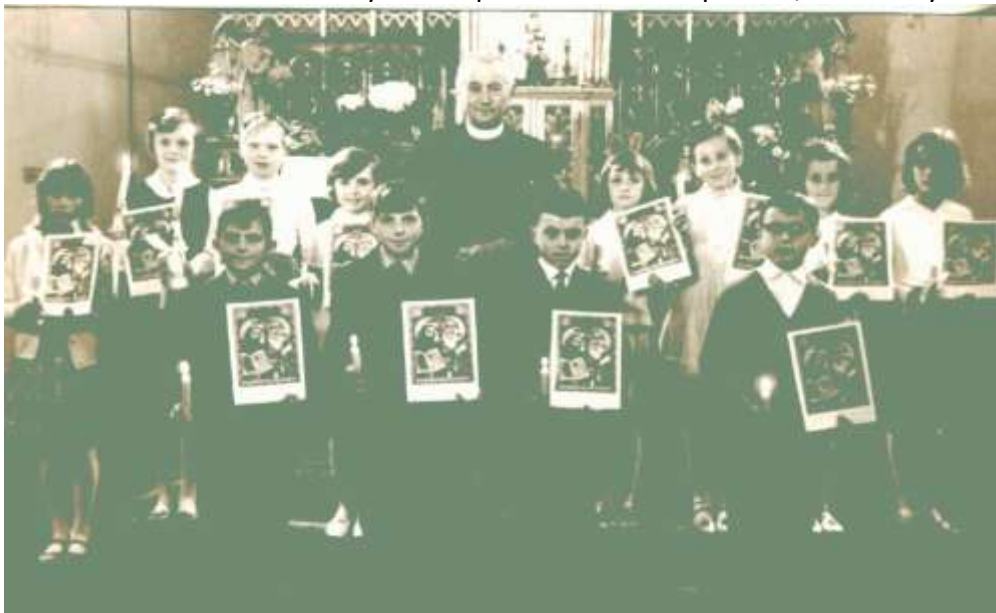
Na snímku s dětmi u prvního sv. přijímání v Černé v Pošumaví.