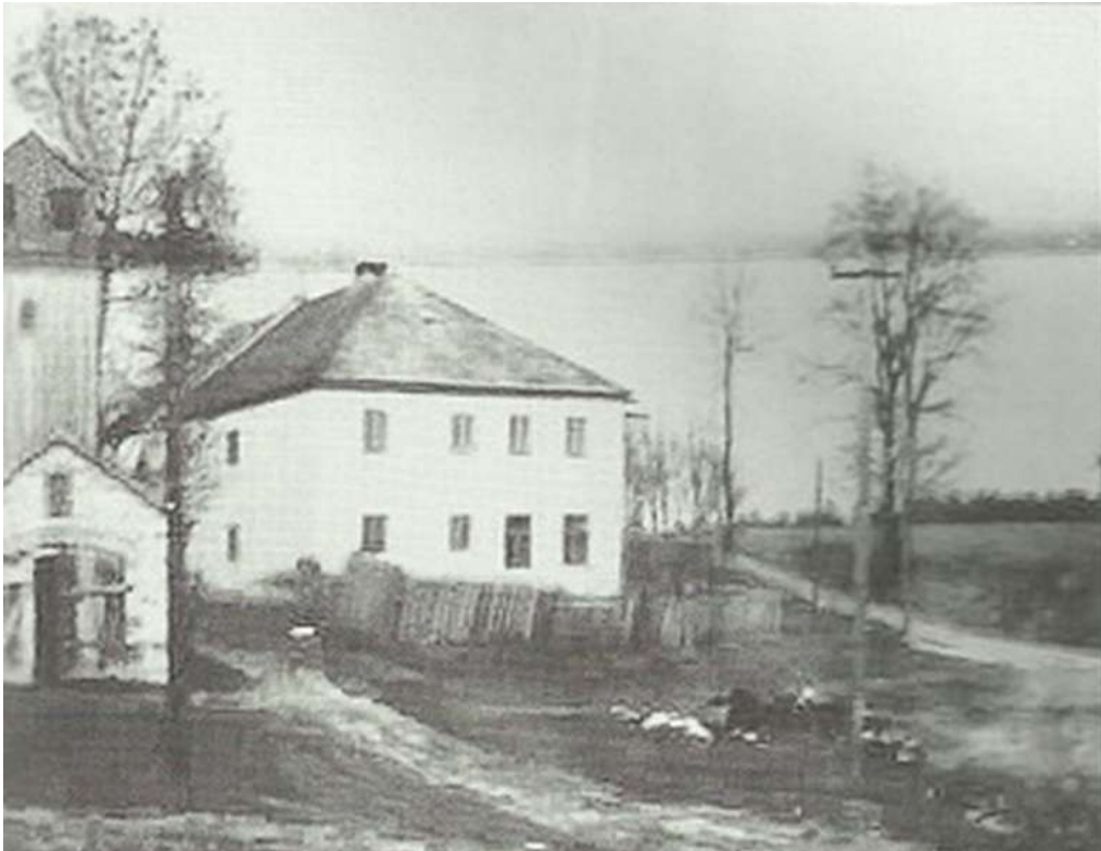
Budova školy na plániče kolem roku 1957