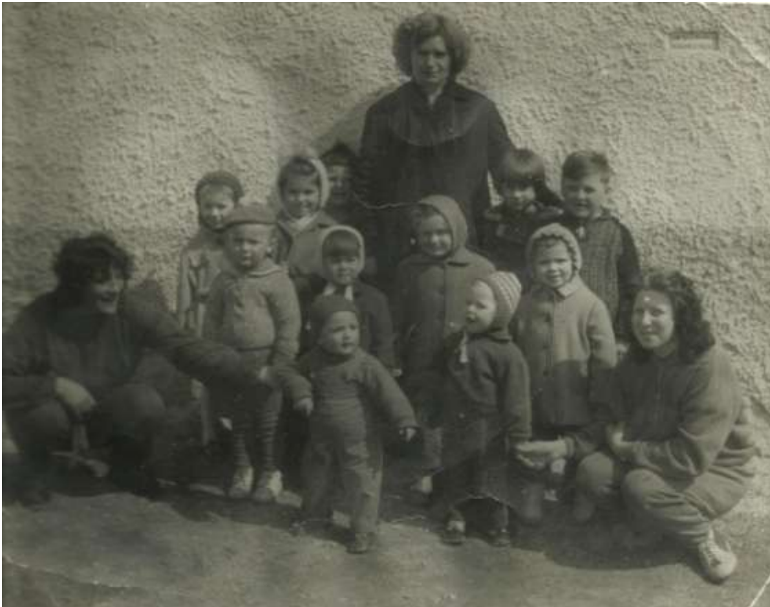
Děti ze školy Bližná

Od 1. září 1962 začaly děti z bliženské školy chodit do školy v Černé v Pošumaví.