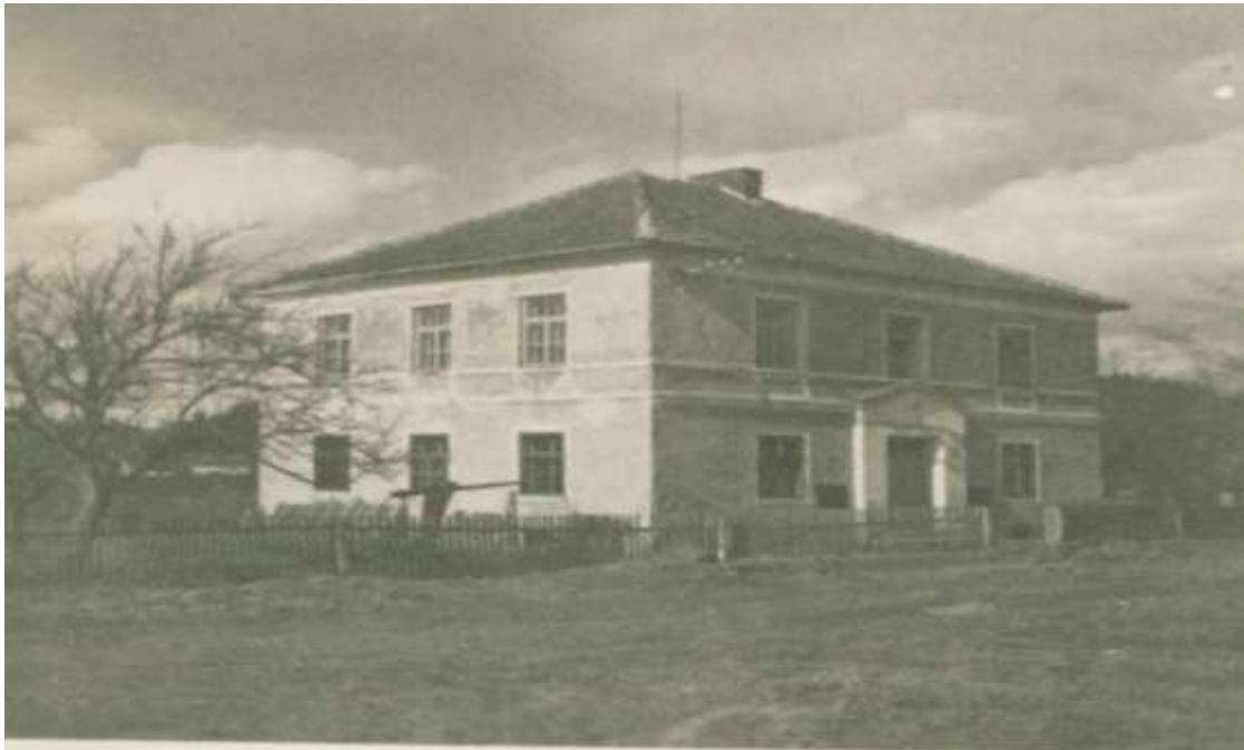
Škola v Bednářích – viz předešlý článek a foto – sloužila svému účelu i po roce 1945

Dne 1. září 1948 byla znovuobnovena jednotřídní, dříve německá škola v Bednářích. Do školy bylo zapsáno celkem 21 žáků, z toho bylo 11 chlapců a 10 dívek, do školy jich však nastoupilo pouze 13, protože osm žáků bylo přerazeno do školy v Černé. Jednalo se o žáky z obvodu Vápenice, která k tomuto školnímu obvodu patří. Ještě v září pak odešli tři žáci do školy v Hořicích a tak konečný stav na konci září 1948 byl pouze 10 dětí.