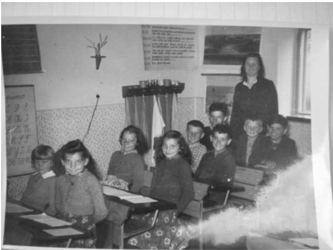
Se svými žáky v pláničské škole.