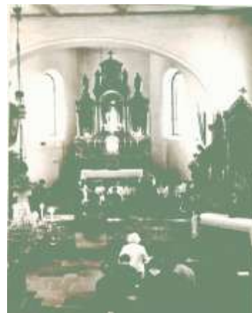
Interiér kostela po úpravě v roce 1977.

23.12.1978 nabyla platnost kupní smlouva manželů Aloise a Hedviky Zwiefelhoferových z Českých Budějovic o odprodeji části pozemku zrušeného hřbitova v Černé v Pošumaví č.kat.71 o výměře 42 m2 a parcela č.70/2 o výměře 156 m2.Jedná se o zastavěnou plochu bývalé márnice, která