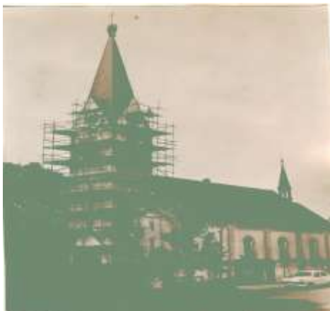
Oprava kostela v Černé v Pošumaví v roce 1976.

MNV v Černé provedl současně přemístění cenné památky – kamenné sochy sv.Jana Nepomuckého z mostu, který byl upravován, k hlavnímu vchodu kostela.