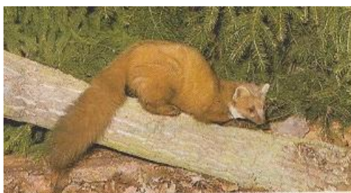
Kuny lesní, kuny skalní

MS mělo v tomto roce 4 lovecké psy - Produkce zvěřiny za rok - 883 kg