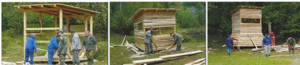
Průběh výstavby střelnice

V dubnu se začal budovat střelnice na kulové a brokové zbraně, obec poskytla MS dotaci ve výši 30 000 Kč. Byla podepsána smlouva o pronájmu honitby na dalších 10 let.