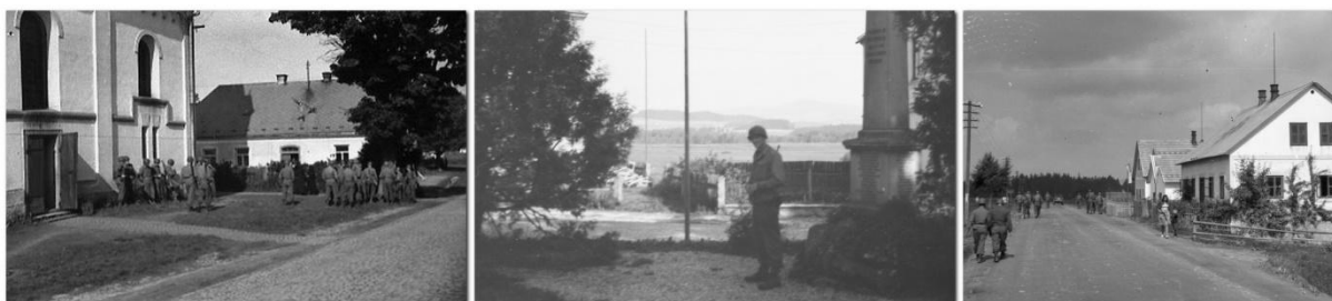
Američtí vojáci v prostoru u kostela + strážící voják u pomníku padlým + cesta do Horní Plané