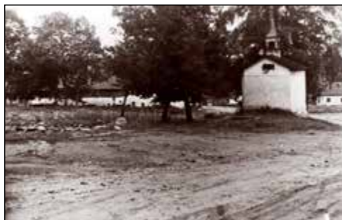
Pohled opačný – zhora dolů