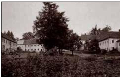
Pohled od spodu směrem nahoru