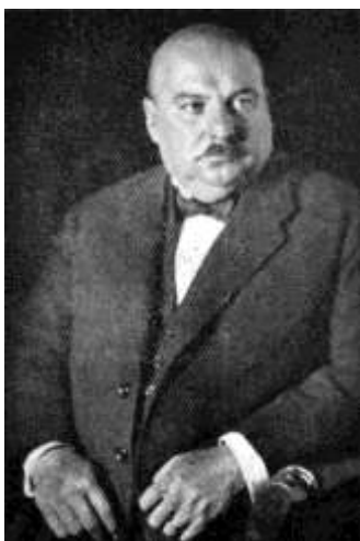
Oskar Nedbal 1930/ rok jeho smrti/