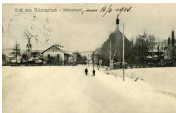
Foto z roku 1920 – vjezd do obce od Dolní Vltavice- vlevo oproti pivovaru rodný dům