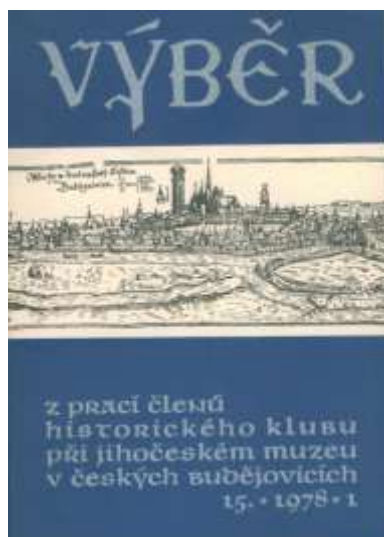
Titulní stránka časopisu, kam J.S. pravidelně přispíval svými články