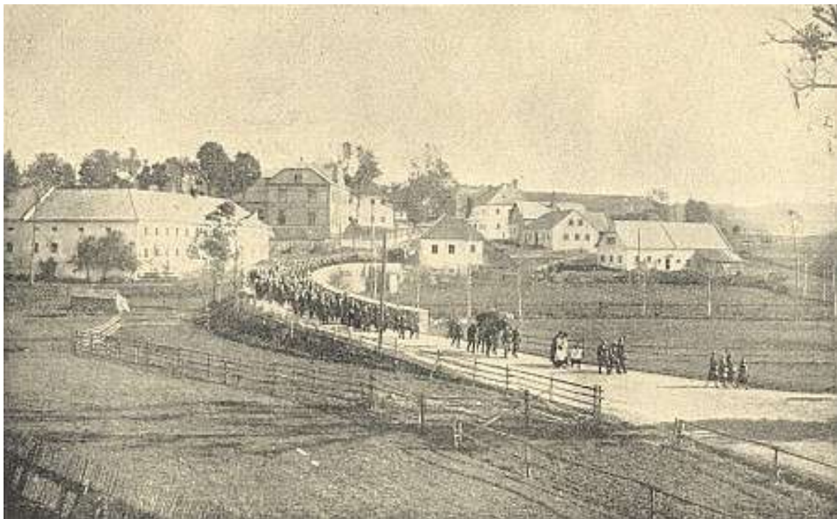
Jeho pohřeb se konal v roce 1929 v Černé – průvod ke kostelu