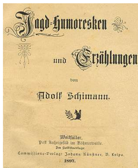
Titulní list jeho díla z loveckého prostředí