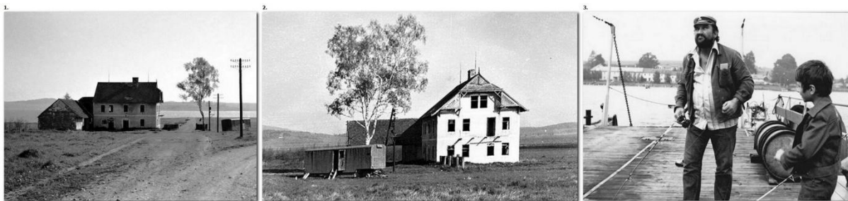
U PŘEVOZU A NA PŘEVOZE – Kyselov – Dolní Vltavice a zpět- dlouholetý převozník Ota Šoka