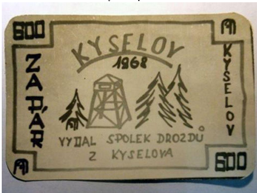
Z roku 1968