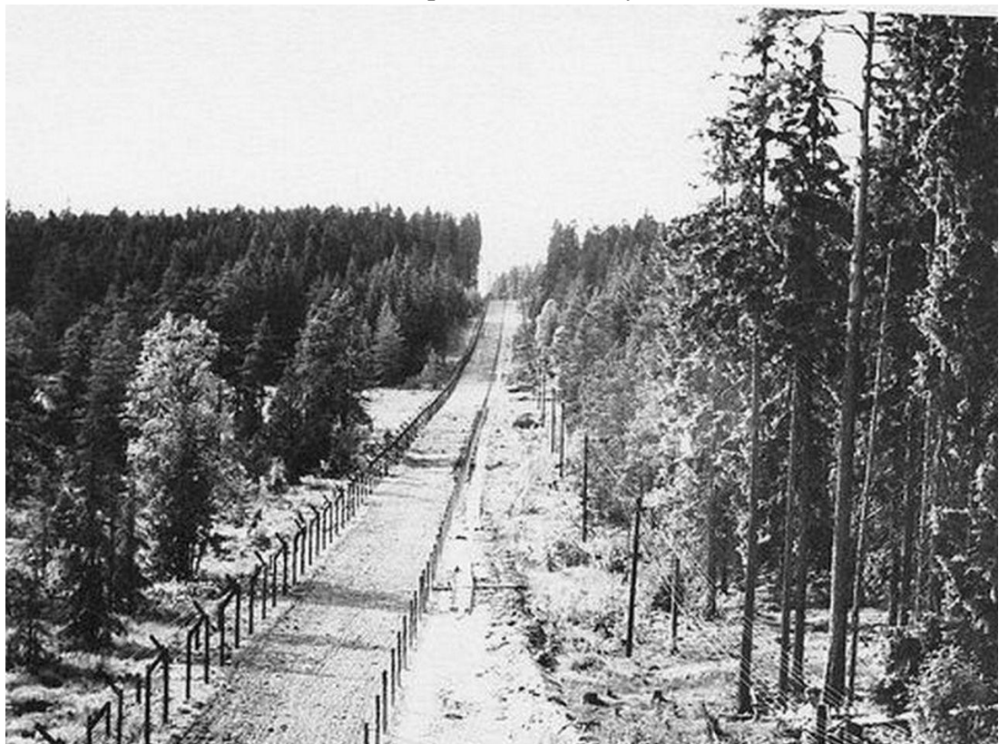
Pohled ze špačkárny