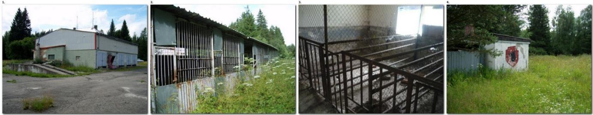
Pohledy do vnitřku budovy PS a příslušenství roty ( mycí rampa a kotce pro psy)

fotky od bývalých vojáků – převážně z roku 2014