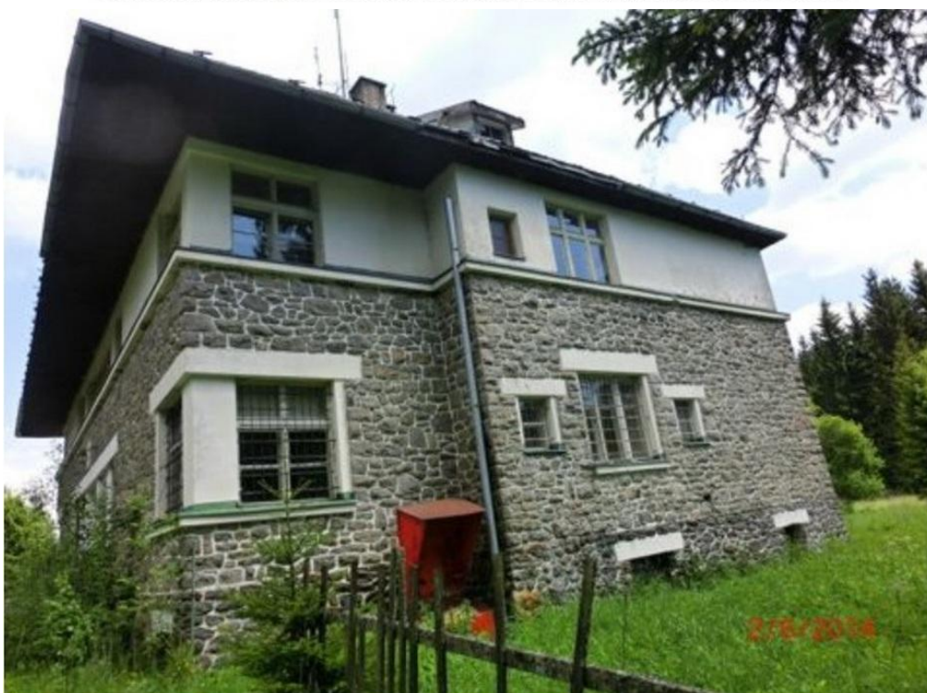
Po víc jak 20 letech bez údržby je bývalá rota stále hezká budova, ale neprodala se a patrně je odsouzená k zániku. Zadní vchod je vyražený a budova volně přístupná....