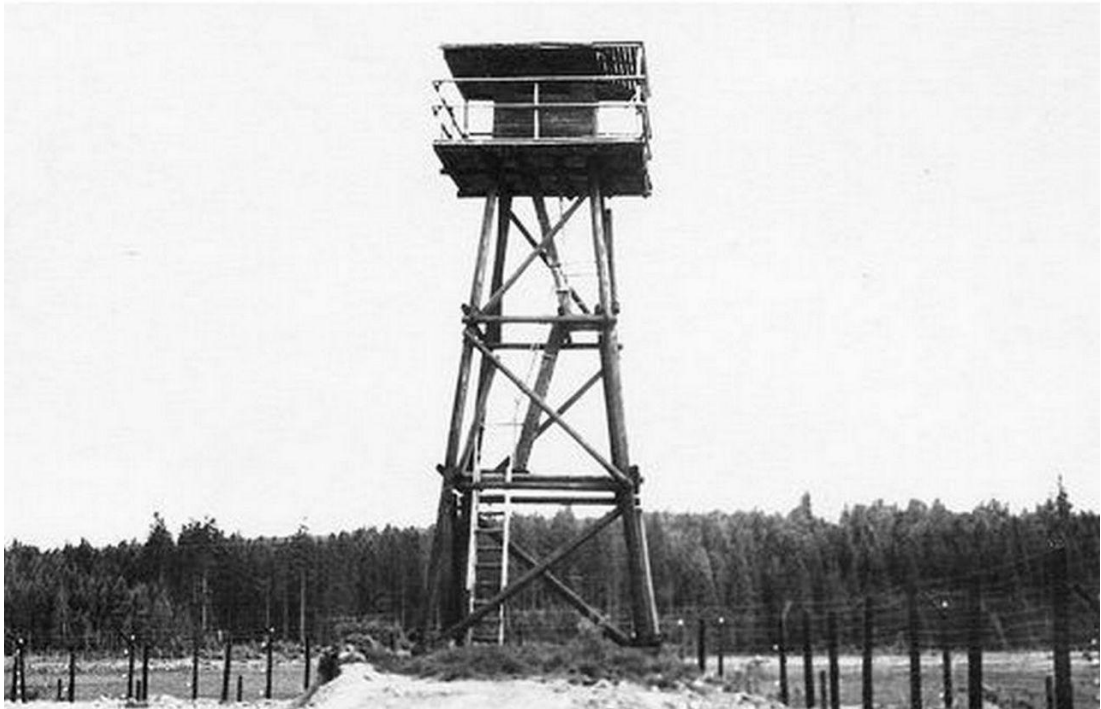
Tzv. špačkárna u zátoky