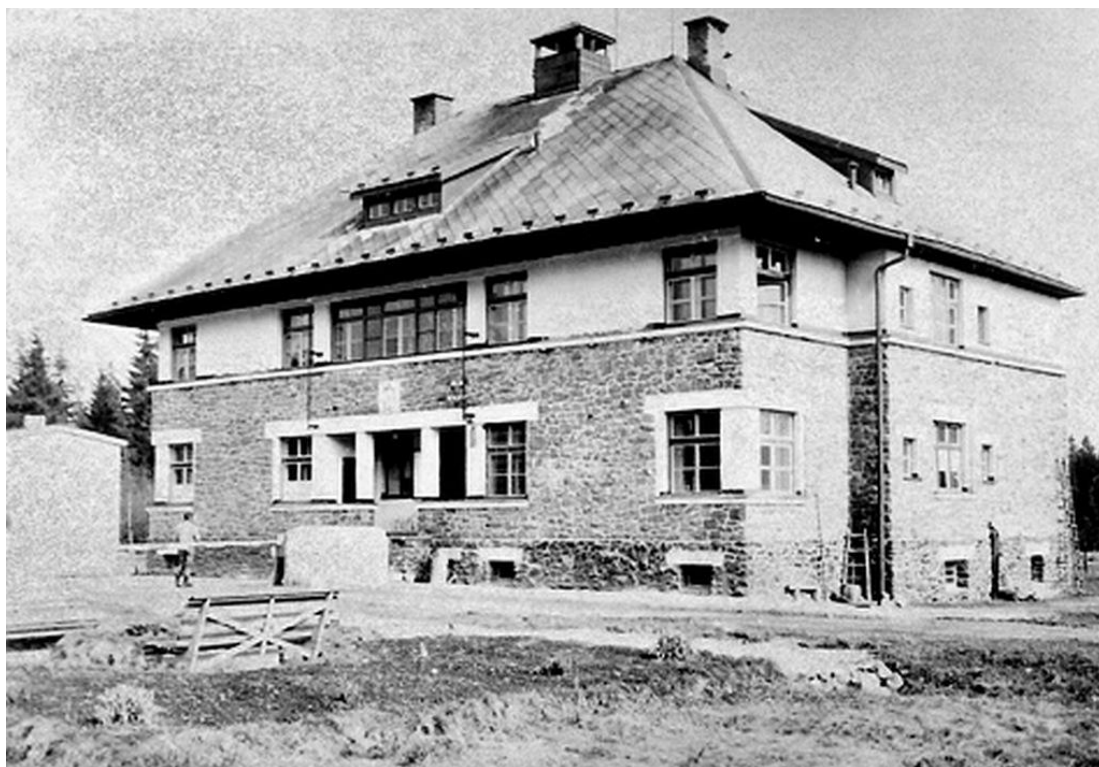
Pohled na budovu rotý v roce 1966 – 1968