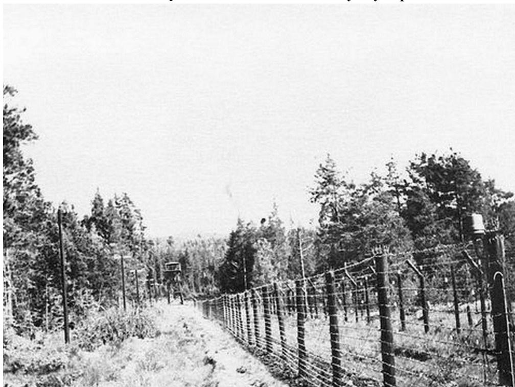
Celní zátarasy, tzv. dráty na PS Kyselov