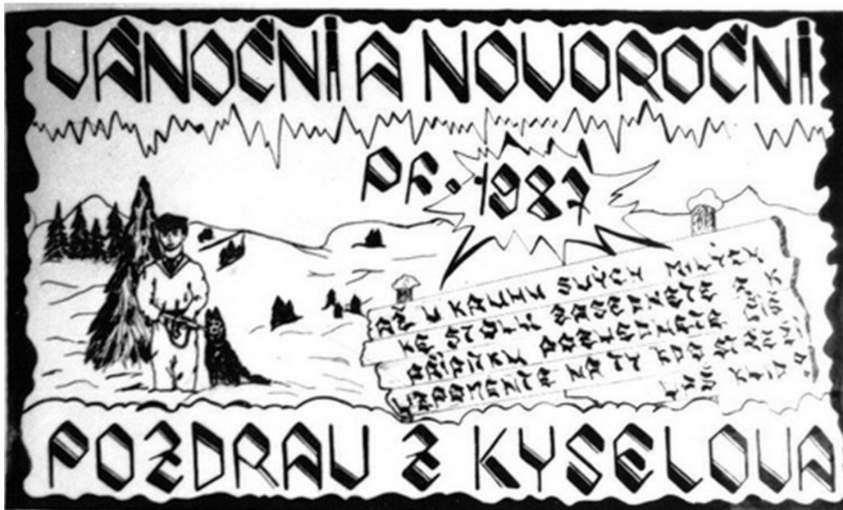
Vánoce a Nový rok – Kyselov 1986 – 1987