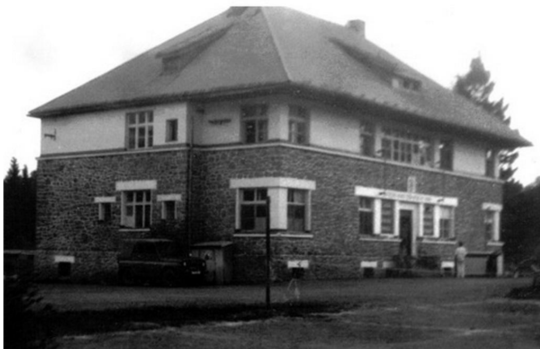
Rota na Kyselově v době činné služby z r. 1986