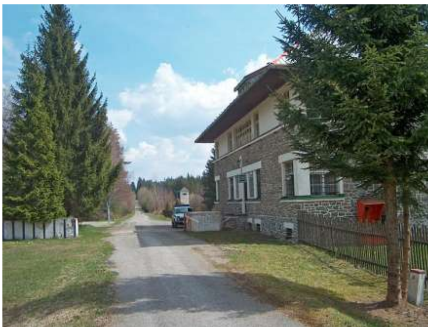
Bývalá rota Kyselov - duben 2004