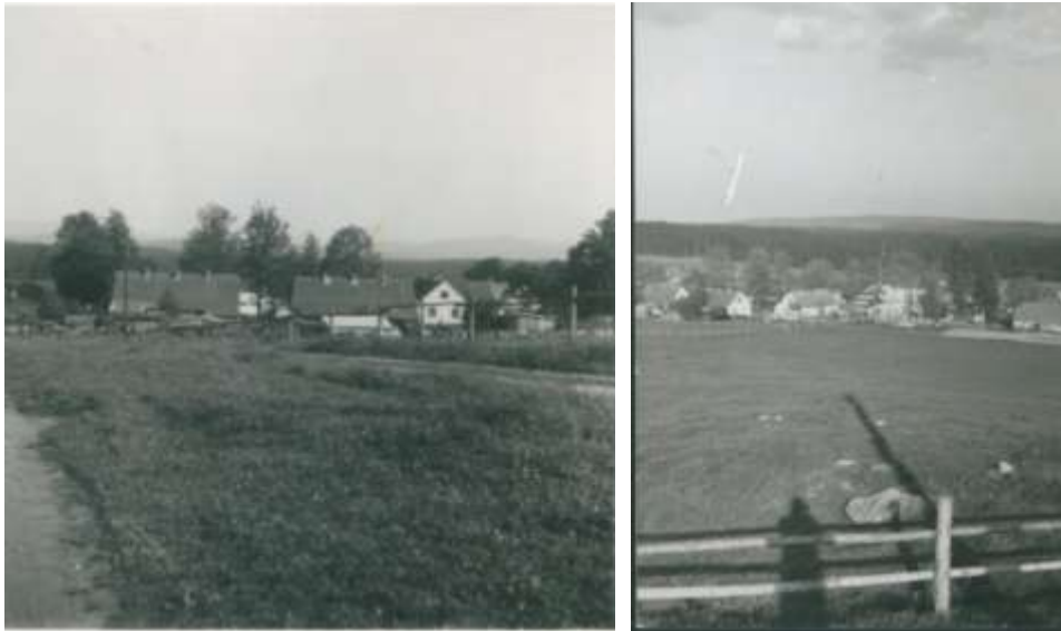
Kolem roku 1975