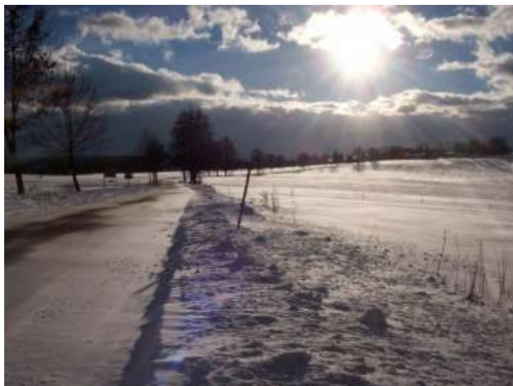
Silnice na Bližnou – Petr Bielik – leden 2004 / internet/