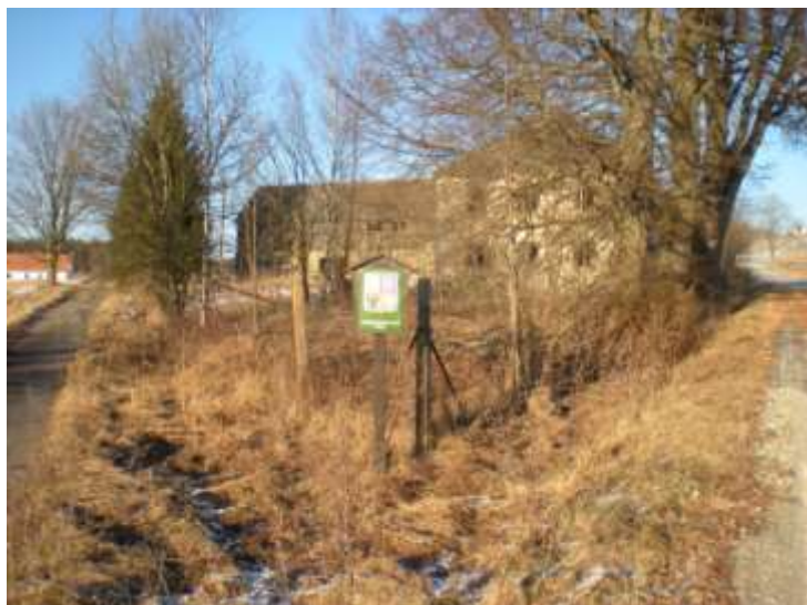
Na křižovatce Baštýř – leden 2009