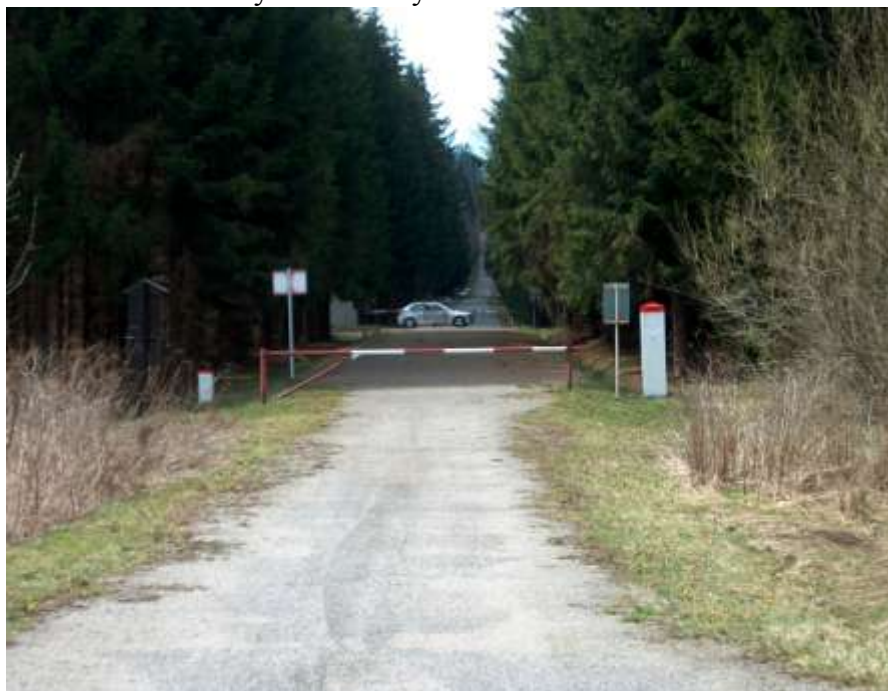
Hraniční přechod / uzavřený/ - duben 2004