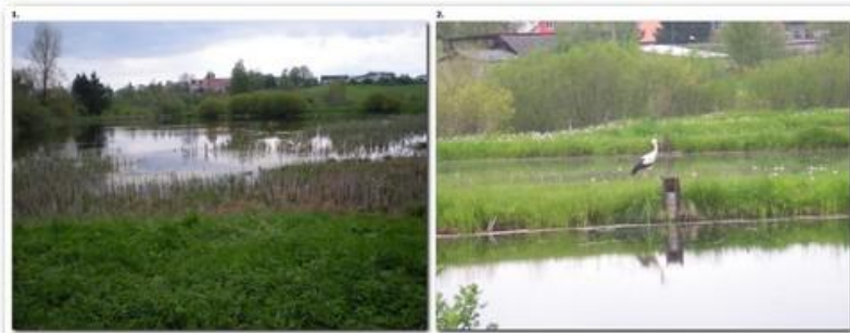
Foto ze zadních rybníčků, které jsou rovněž součástí firmy Rybářství, s.r.o.