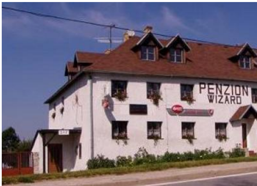
Budova č.p. byla určena k demolici, od roku 1989 zde však bylo na čas zřízeno zdravotní středisko. Dnes hotel Wizards.