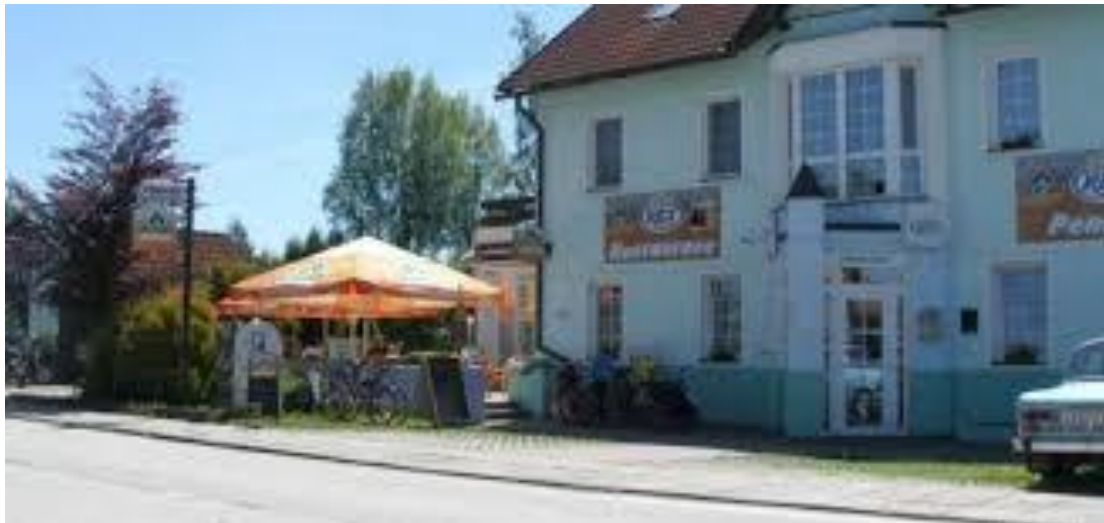
V budově čp.47 bylo zřízeno úplně první Zdravotní středisko, přemístěné z Hůrky. Ordinance zde byly až do roku 1988. Po revoluci byl objekt zprivatizován – v současnosti hotel REX