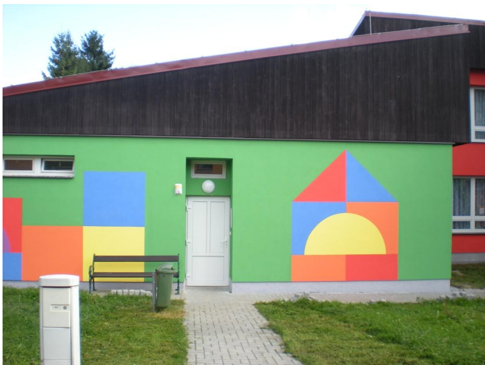
Objekt Mateřské školy, kam byla přesunuta zřivotní ambulance. Definitivně to bylo v roce 1994.