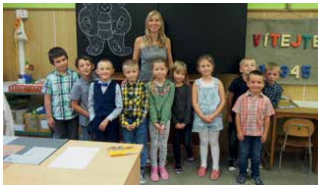
Prvnáčky ze ZŠ Černá v Pošumaví ve školním roce 2020/2021