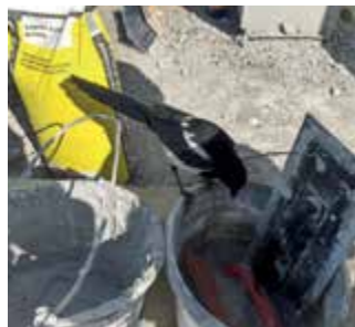
Straka bývala i účastníkem výstavby bankomatu u OÚ

V pátek 29. září však už straka neuletěla. Děti jí chytily na hřišti v horní části obce a začaly do ní tlouct klacky. Když pak zůstala v bezvědomí, hodily jí na zahradu majiteli. Straku musel ošetřit veterinář, měla nožičku minimálně dvakrát zlomenou, přerušené šlachy, zlomené křídlo, oko zalité zánětem.