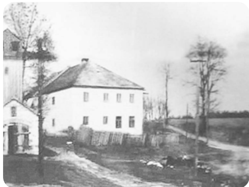
Škola v Plániče vedle hasičárny.