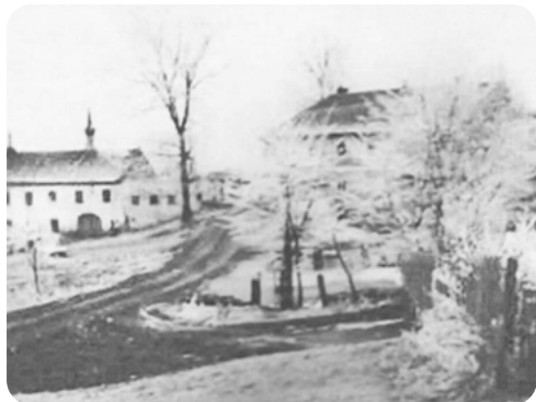
Dobová fotka Pláničky.