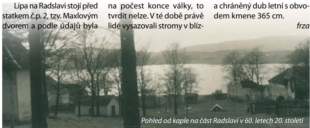
Pohled od kaple na část Radslavi v 60. letech 20. století