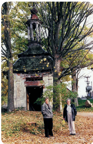
Kaple v Radslavi před opravou byla v hodně špatném stavu. Obnovy se dočkala v roce 1995.