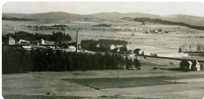
Pohled přes tuhové závody v Hůrce směrem na Jestřábí (vzadu vpravo)

K zemědělským účelům sloužil dvůr nadále i po válce. Z doby Schwarzenberků však zůstaly pouze tři objekty.