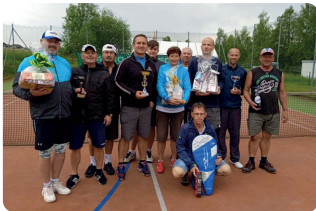
Závěrečné foto na kurtech.