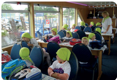
Na výletě parníkem.