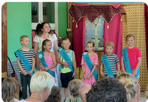
Pasování na prvňáčky.