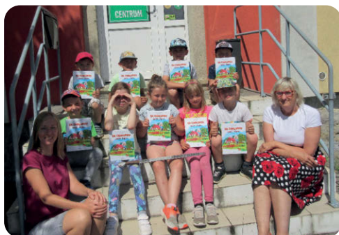
Pasování prvňáčků na „Malé čtenáře“.