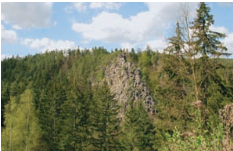
Dívčí skála ve vltavském údolí nedaleko hradu Dívčí Kámen.