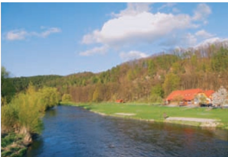
Údolí řeky Vltavy ve Zlaté Koruně.