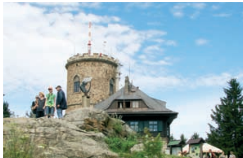
Hora Kleť, rozhledna s turistickou chatou.