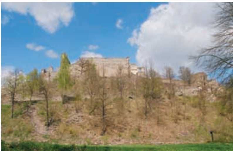
Dívčí Kámen, pohled na hradní zříceninu od jihu.