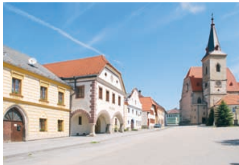
Chvalšiny, náměstí s kostelem sv. Máří Magdalény.