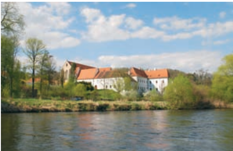
Zlatá Koruna, klášter cisterciáků.