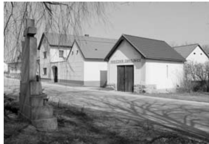
Dolní Třebonín, pomník padlých na návsi.