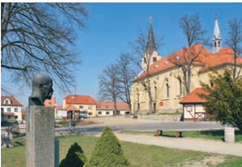
Křemže, kostel sv. Archanděla Michaela.