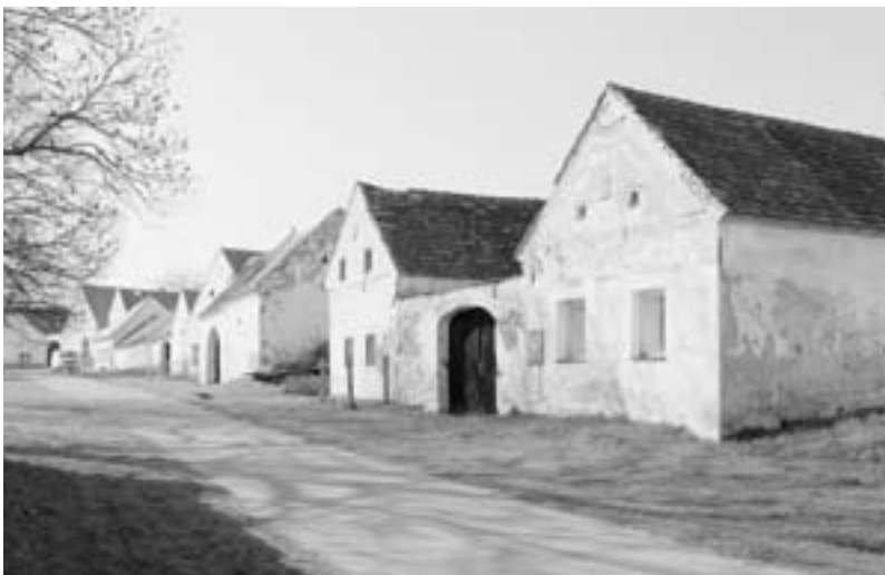
Čertyně, usedlosti na návsi.