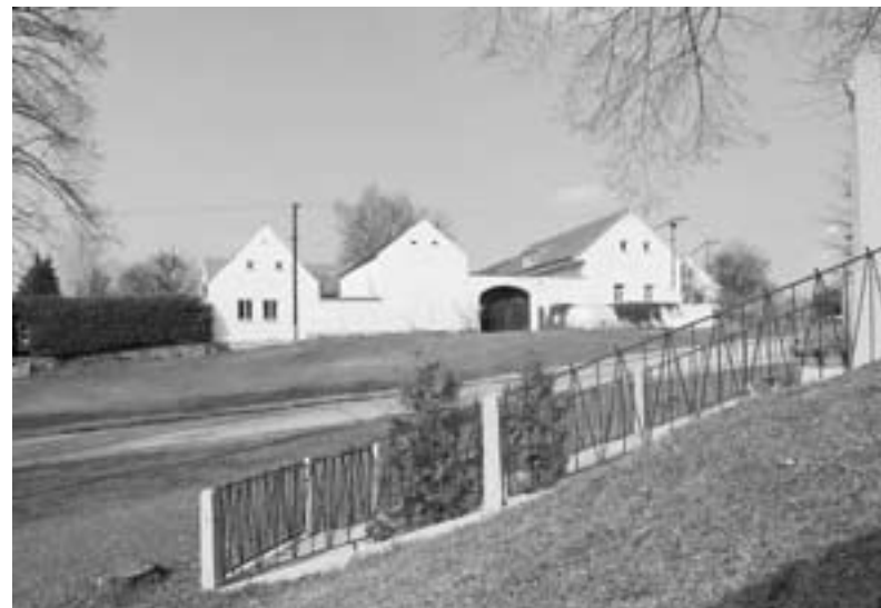
Mojné, pomník padlých na návsi.

Obec bývala v majetku pánů ze Strakonice a v roce 1315 ji Bavor III. věnoval klášteru Zlatá Koruna za to, že v klášteře mohl být pohřben. V roce 1787, po zrušení kláštera ve Zlaté Koruně, byla obec připojena k panství