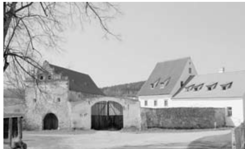
Štětkře, renesanční tvrz (č. p. 1).

V době senoseče se chodilo ráno ve 3 hodiny sekat trávu na seno, přes den se seno sušilo a svázelo a za tmy se poklízal dobytek. Výmlat obilí se prováděl buď ručně celý nebo mlátičkou, kterou poháněl žentour a čistilo se ručně mlyn-