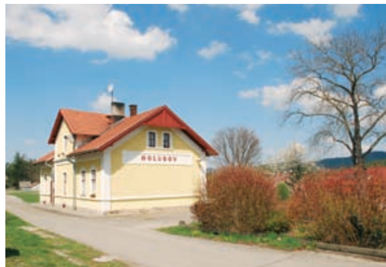
Holubov, budova nádraží.