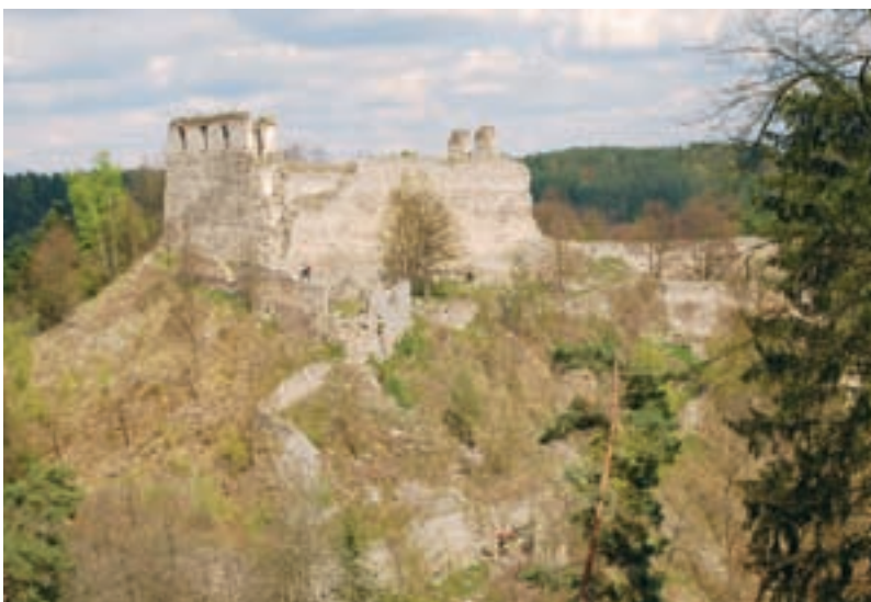
Dívčí Kámen, pohled na hradní zříceninu od jihozápadu.