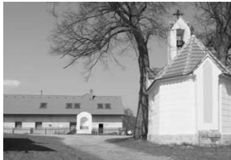
Horní Třebonín, návsní kaple.