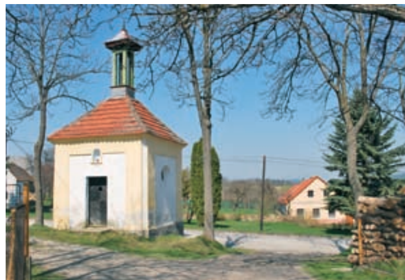
Loučej, návsní barokní kaple.