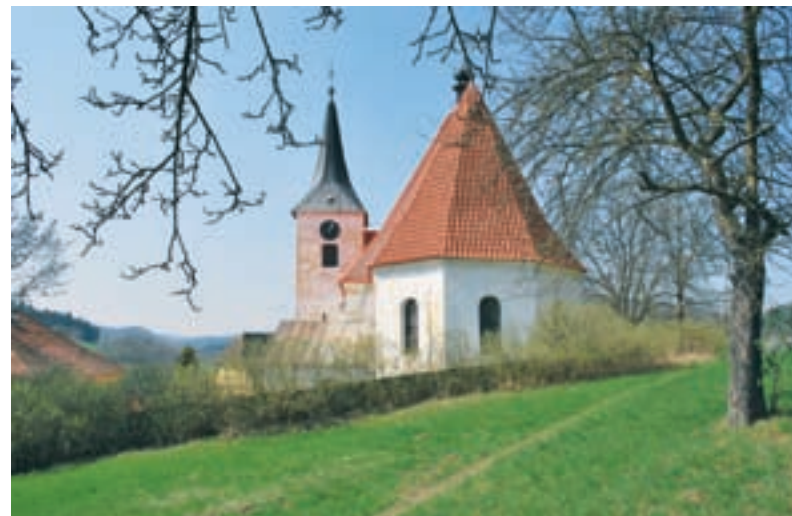
Brloh, kostel sv. Šimona a Judy.