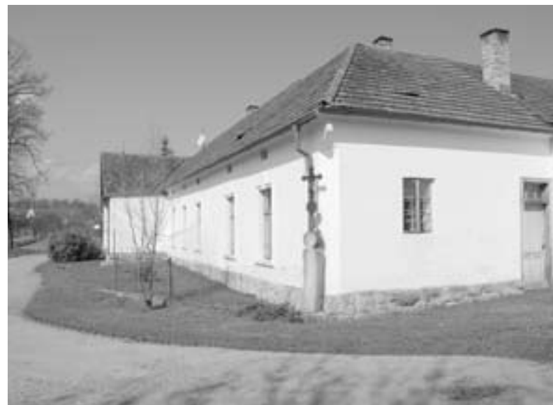
Dolní Svince, návěs.